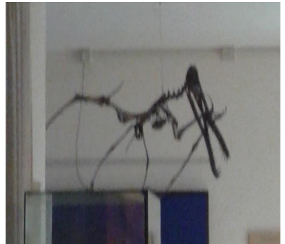
foto 6 - riproduzione pterodattilo