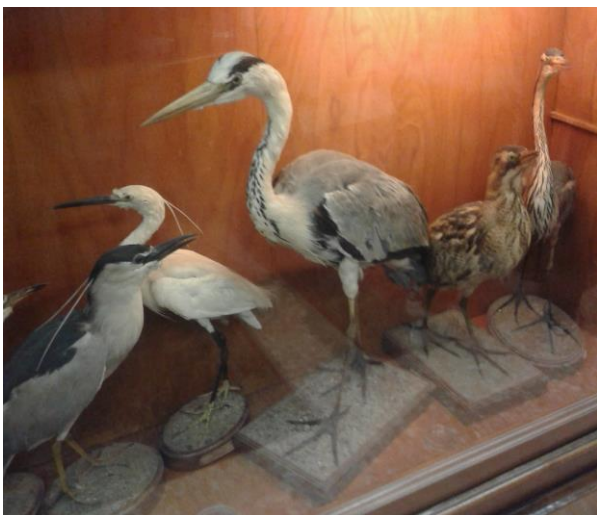
foto 1 - avifauna lacustre