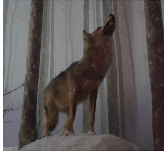
foto 3, 4 - daino e lupo nelle riproduzioni dei loro habitat invernali, della Foresta Umbra