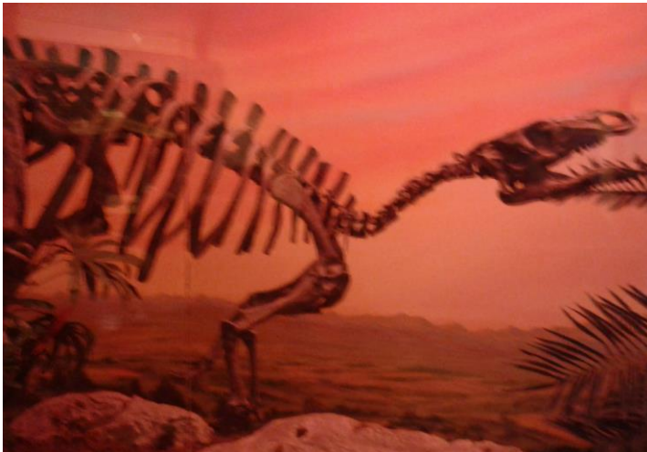
foto 5 - riproduzione dinosauro erbivoro bipede