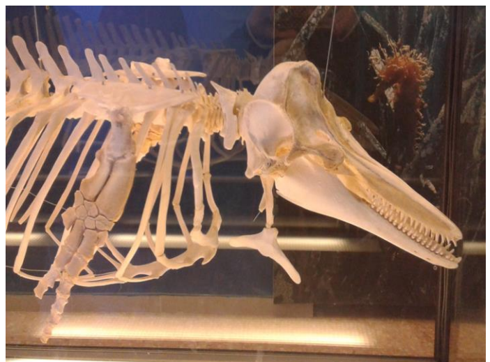
foto 2 -scheletro di delfino